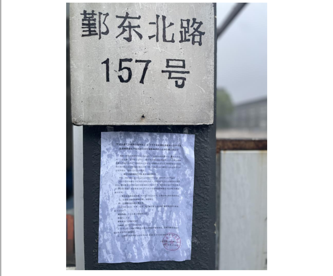
附图 4-2 厂区张贴公示图